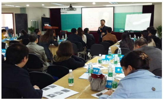
沙坪坝分行（两天）课程