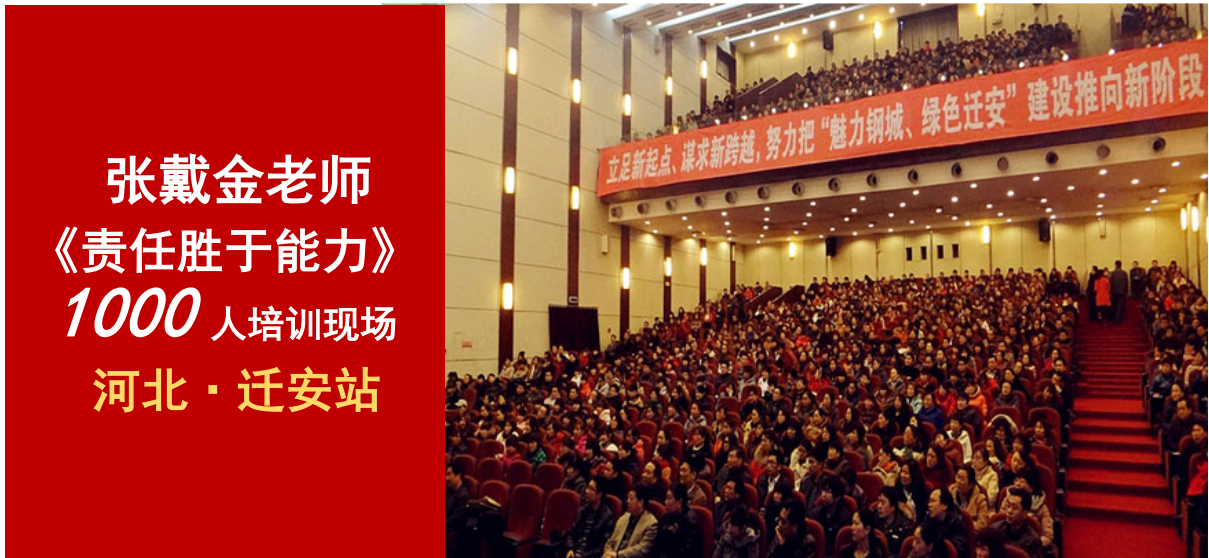
张戴金老师 《责任胜于能力》 1000 人培训现场 河北 · 迁安站