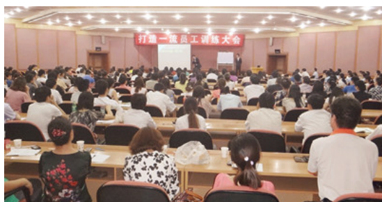
四川攀枝花大型公开课现场