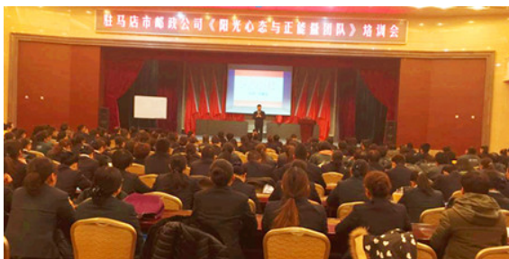
市邮政公司 500 人参加