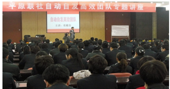
平原联社内训现场