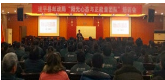
遂平县邮政局 210 人参加