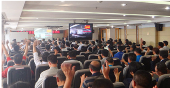
桂林*银行内训课程现场