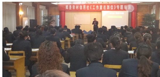
郑县农村信用合作社内训