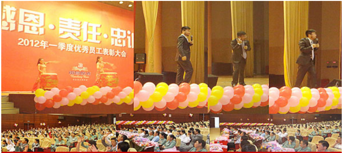
南昌啤酒内训课程现场