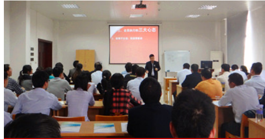
广州*企业内训课程现场