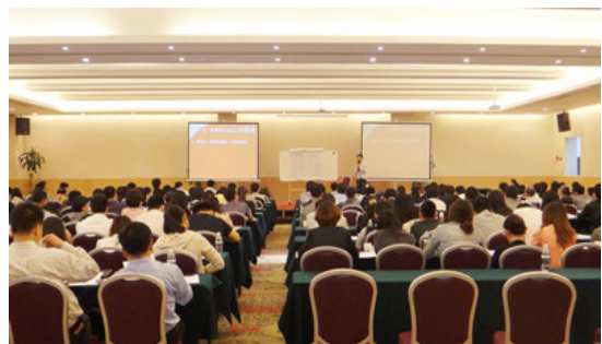
广州承德大型公开课现场