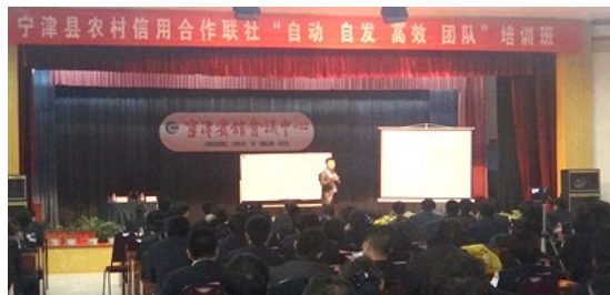
宁津县农村信用合作社内训