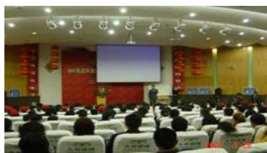
江西九江大型公开课现场