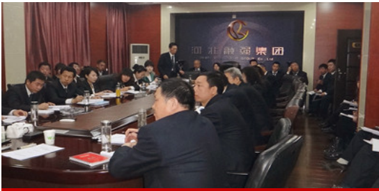
融强集团内训课程现场