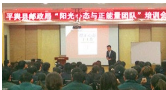
平舆县邮政局 180 人参加