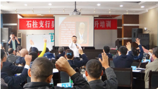
石柱支行（两天）课程