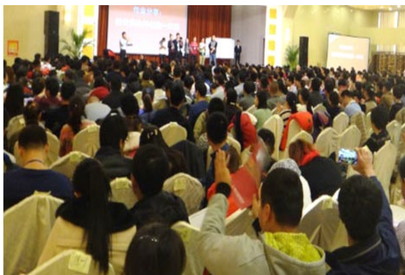
《一流企业·一流员工》 1000 人 培训课程现场 新疆·乌鲁木齐