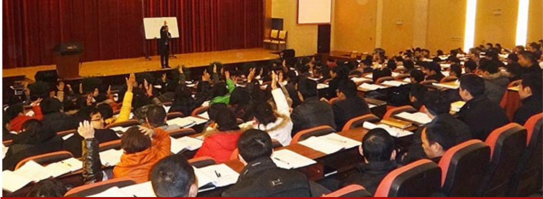
江苏红豆集团内训现场