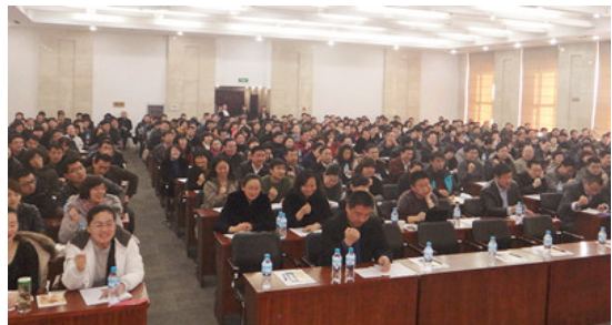
河北承德大型公开课现场