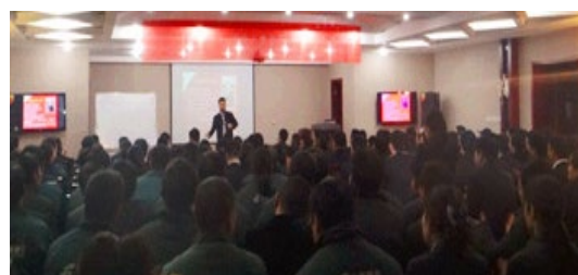
泌阳县邮政局 230 人参加