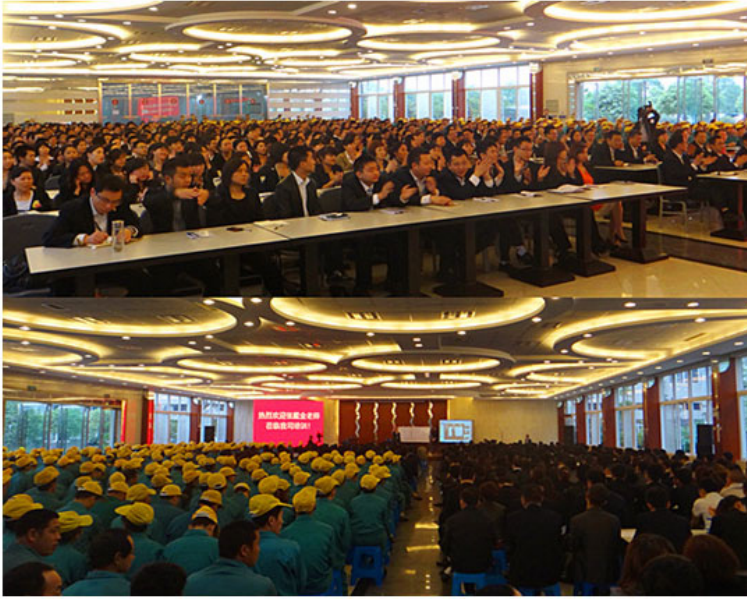
张戴金老师 《从精兵到干将》 1000 人内训现场 四川 · 眉山站