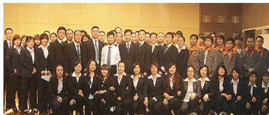
贵州*国营企业请张老师做内训