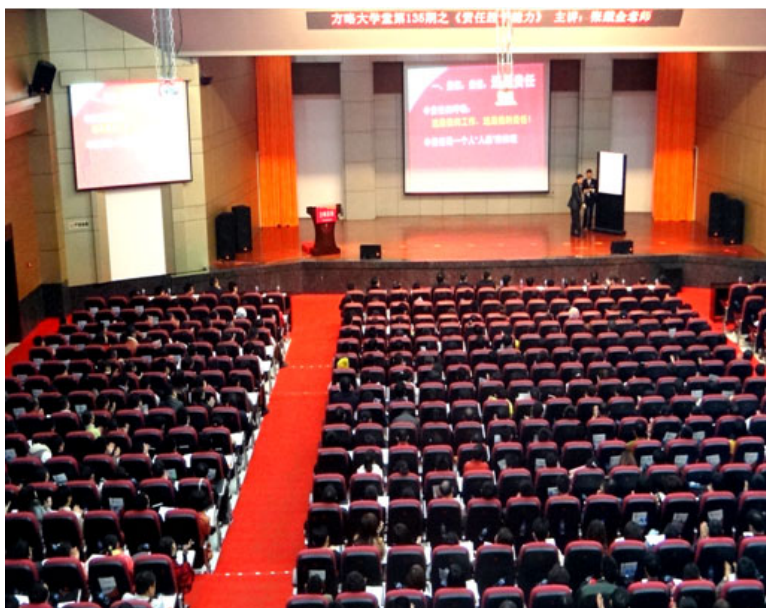
张戴金老师 《责任胜于能力》 1000 人培训现场 海南 · 海口站