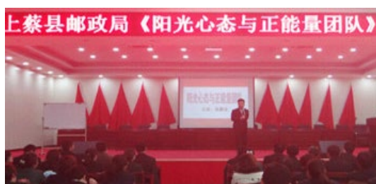
上蔡县邮政局 260 人参加