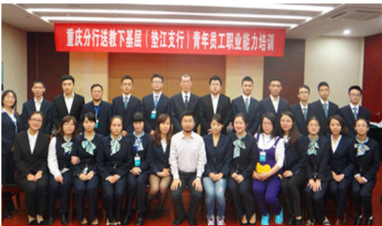
垫江支行（两天）课程