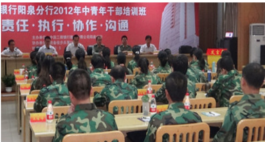
工商银行阳泉分行内训现场