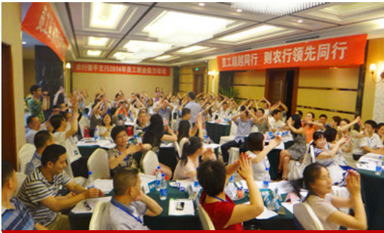
梁平支行（两天）课程