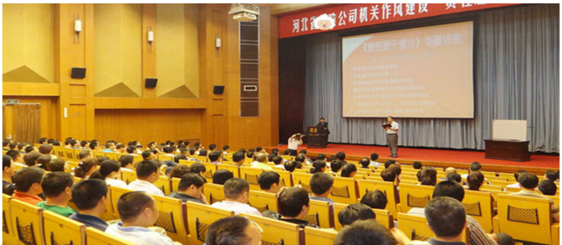
河北省邮政公司内训课程现场