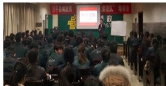
西平县邮政局 160 人参加