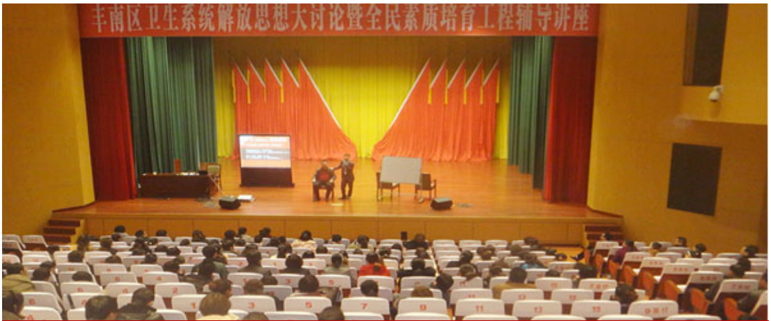
丰南区卫生系统内训课程现场