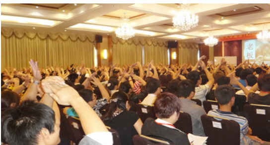
海南三亚大型公开课现场