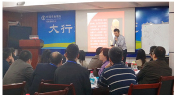
荣昌支行（两天）课程