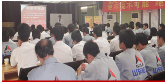
千里马机械公司内训现场