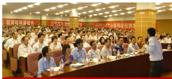
山西太原大型公开课现场