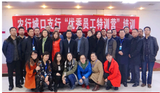
城口支行（两天）课程