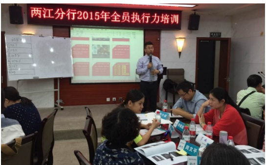
两江分行（两天）课程