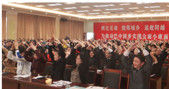
四川巴中大型公开课现场