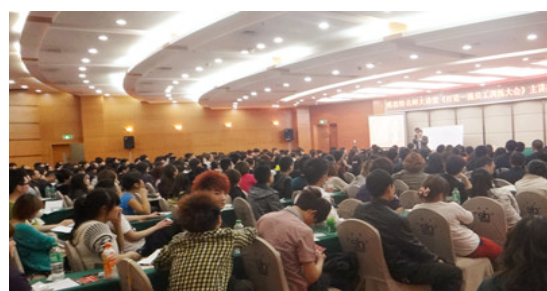
重庆合川大型公开课现场