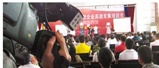
贵州六盘水工商联为企业做内训