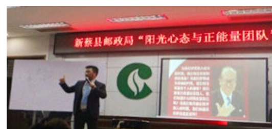
新蔡县邮政局 200 人参加