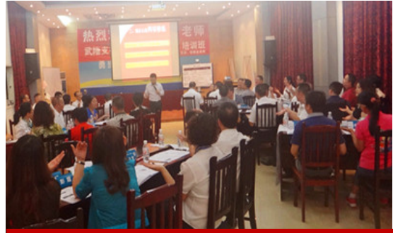
武隆支行（两天）课程