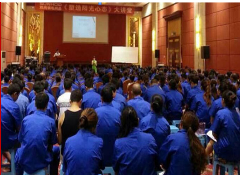
《塑造阳光心态》 1400 人 轮训课程现场 成都·双虎家私