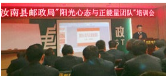
汝南县邮政局 160 人参加