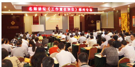
湖南郴州大型公开课现场