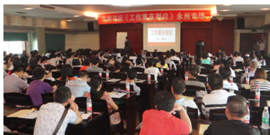
湖南永州大型公开课现场