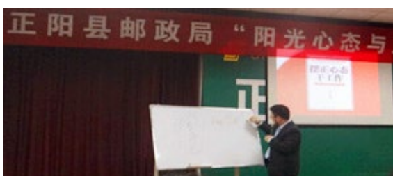
正阳县邮政局 150 人参加