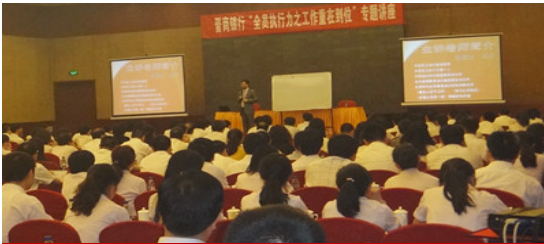
晋商银行内训课程现场