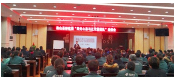
确山县邮政局 180 人参加