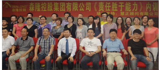
森隆控股集团内训现场