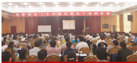
岳阳大型公开课现场