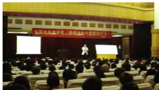
重庆大型公开课现场