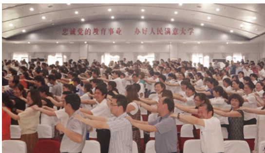
湖北十堰大型公开课现场