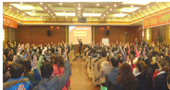
四川南部大型公开课现场